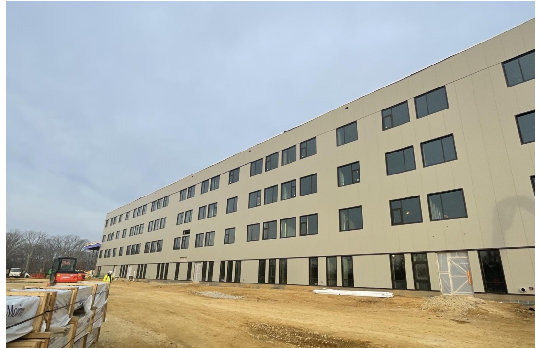
Vue de la tour de 4 étages.