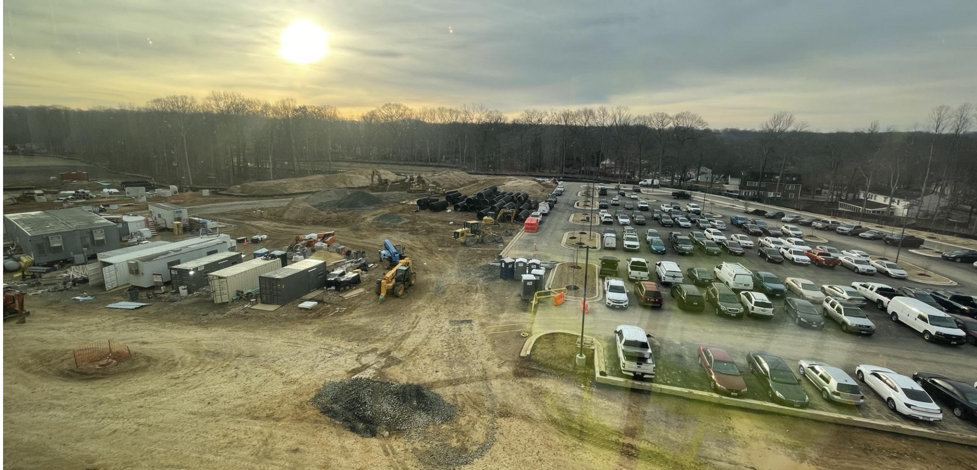
Aire de stationnement