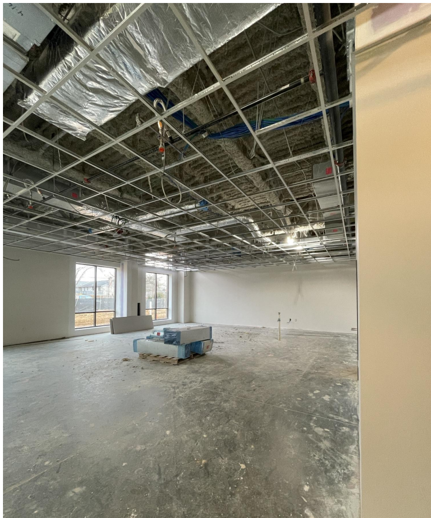
Salle de classe au niveau 1 de la zone nord.