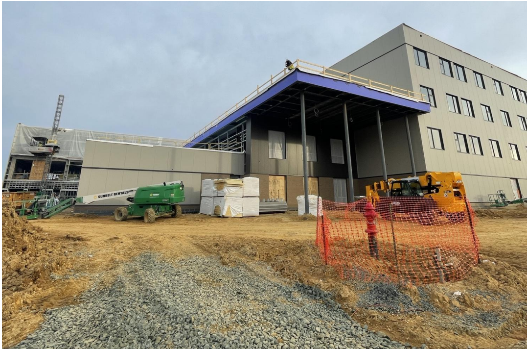
Vue de l'entrée ouest.