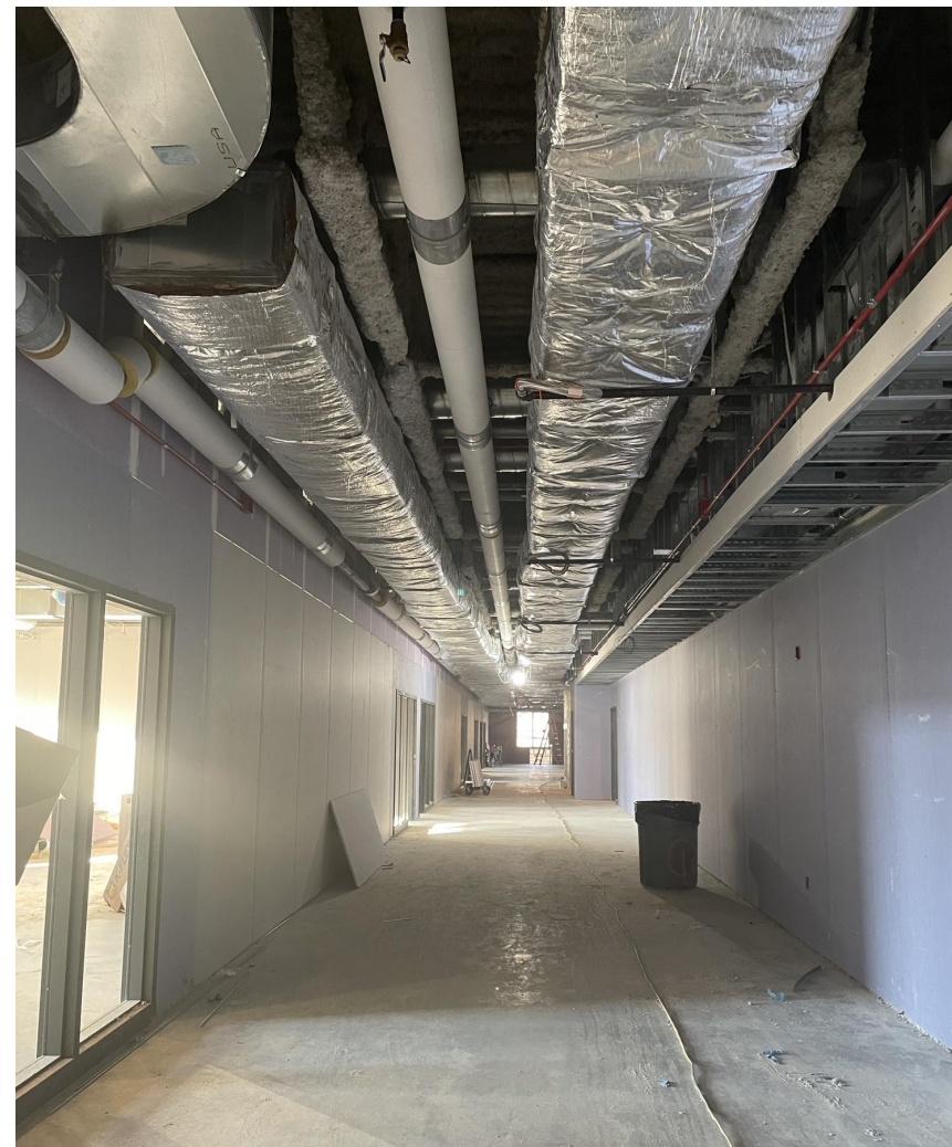
Couloir au niveau 2 de la tour de 4 étages.