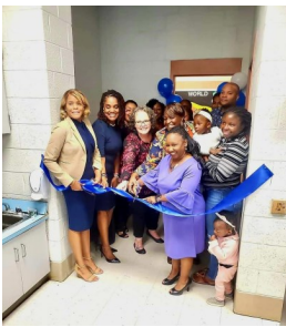
Families and partners joined the Judy Center staff at the Bradbury Heights Judy Center Grand Opening.