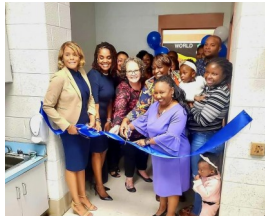
Families and partners joined the Judy Center staff at the Bradbury Heights Judy Center Grand Opening.

para el éxito escolar. Todos los participantes recibirán una bolsa de Raising A Reader con libros para leer en casa. Los padres aprenderán a utilizar el programa. Para obtener más información, comuníquese con el Judy Center al 301-817-0570 o comuníquese con el maestro de preescolar de su hijo.