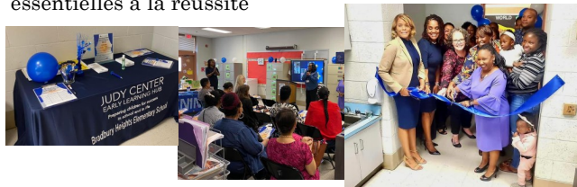
Les familles et les partenaires ont rejoint le personnel du centre Judy lors de l'inauguration du Centre Judy de Bradbury Heights.