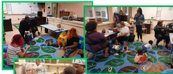
Hillcrest Heights Judy Center families with young children play, explore, and learn during playgroups.